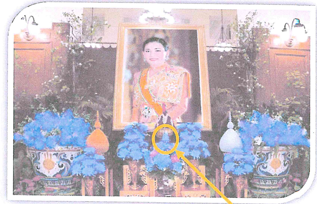
ตัวอย่างการประดับโต๊ะหมู่